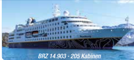
BRZ 14.903 · 205 Kabinen