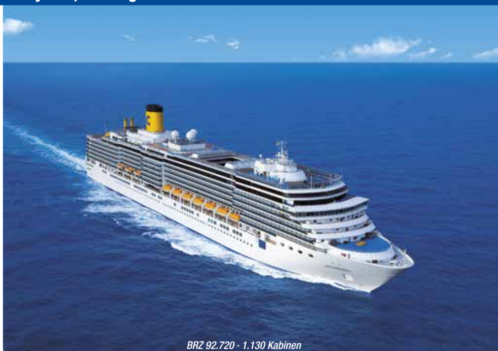
BRZ 92.720 · 1.130 Kabinen