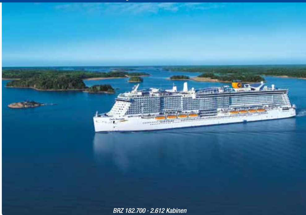
BRZ 182.700 · 2.612 Kabinen

COSTA SMERALDA , Komfort-Klasse 8 Tage, 05.09. – 12.09.2026