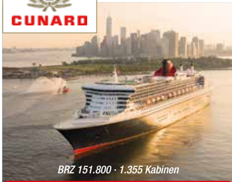
BRZ 151.800 · 1.355 Kabinen