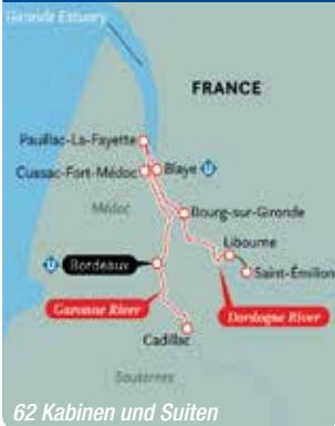
62 Kabinen und Suiten

8 Tage, August bis Oktober 2022 und April bis Oktober 2023