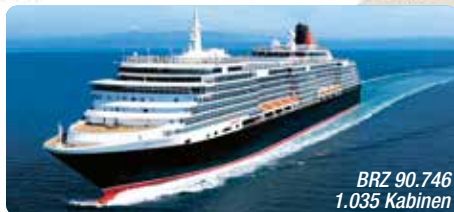
BRZ 90.746 1.035 Kabinen