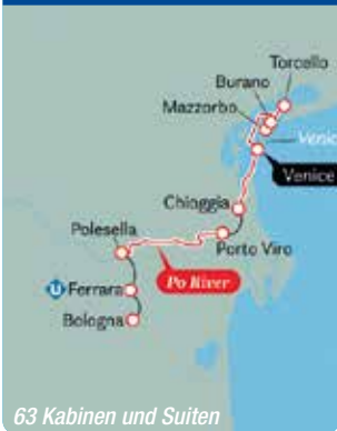
63 Kabinen und Suiten

8 Tage, August bis Oktober 2022 und April bis Oktober 2023