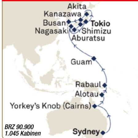
BRZ 90.900 1.045 Kabinen