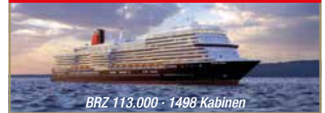
BRZ 113.000 · 1498 Kabinen